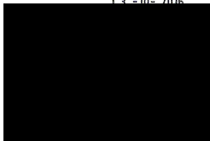
ředitel Regionální pobočky Brno, pobočky pro Jihomoravský kraj a Kraj Vysočina

VEŠTEČNÁ ZDRAVOTNÍ POJIŠŤOVNA ČESKÉ REPUBLIKY Regionální pobočka 5 - (B4)